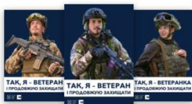
Соціальна реклама «Я — ветеран»