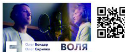
Проєкт ветеранської пісні «АртФронт»