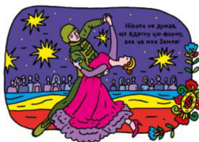
Флешмоб #ПозивнийУкраїна + інформкампанія в метро Києва